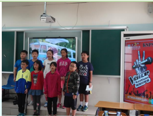
▲閩語歌謠—演唱「心花開」