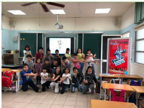
▲閩語歌謠表演情形