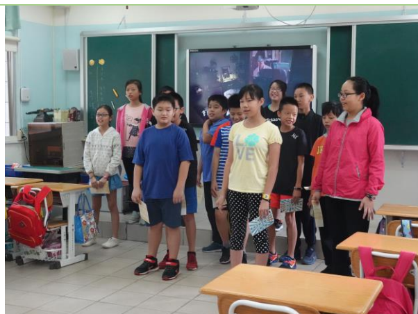
▲閩語歌謠—演唱「魚仔」