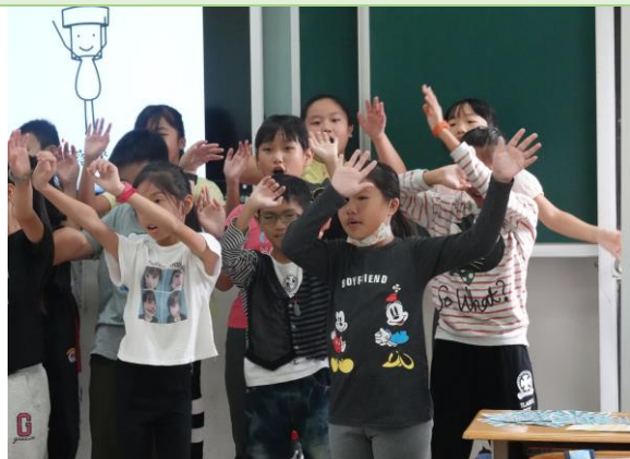
▲ 搭配動作、更添趣味