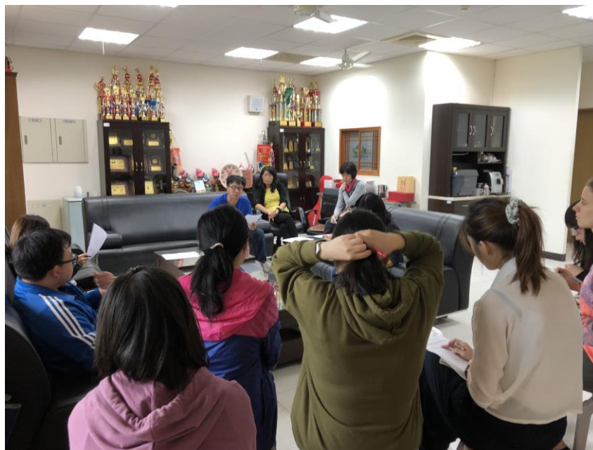
▲實施成效檢核出席情形