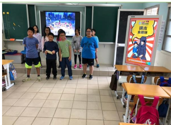
▲ 閩語講古表演情形