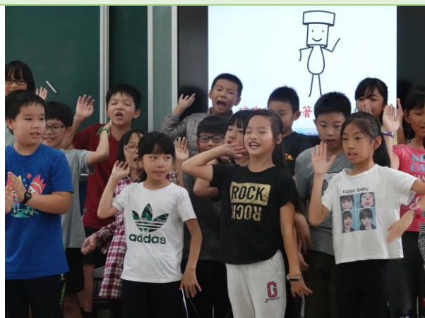
▲閩語唱跳—演唱「丟丟銅」