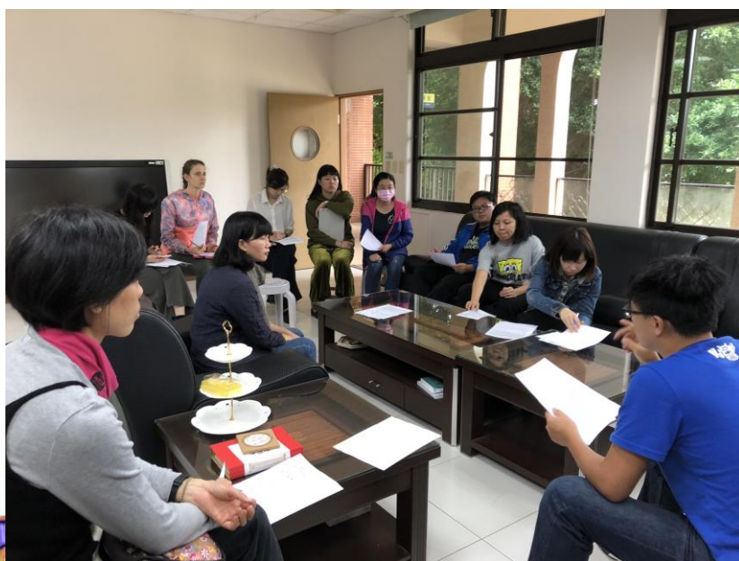
▲學校母語推動圓滿成功