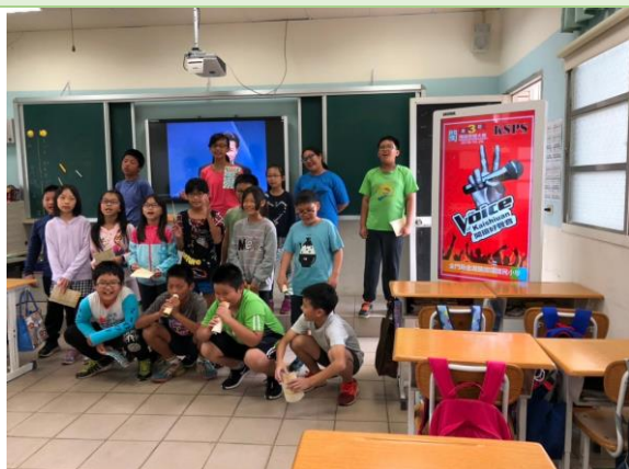
▲閩語歌謠表演情形