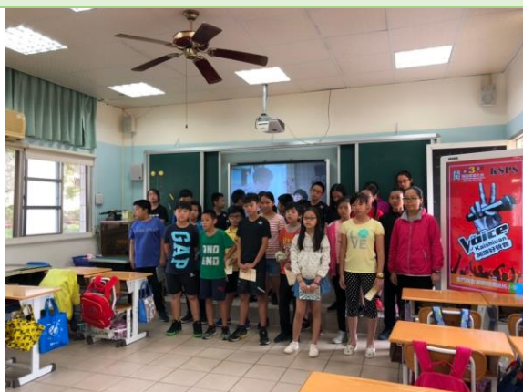
▲評審講評，班級大合唱