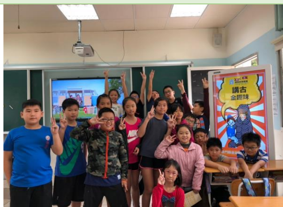
▲ 閩語活動圓滿成功