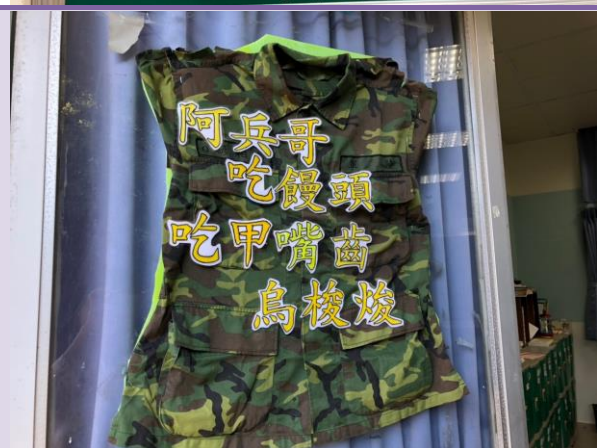
▲各班—教室佈置—母語專欄—布置情形