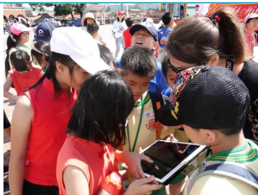
掃 QR-CODE 取得任務