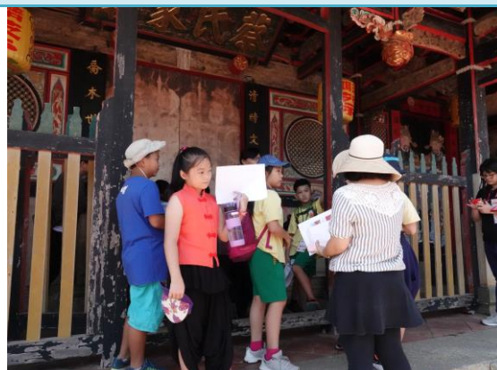
認真聆聽歷史由來