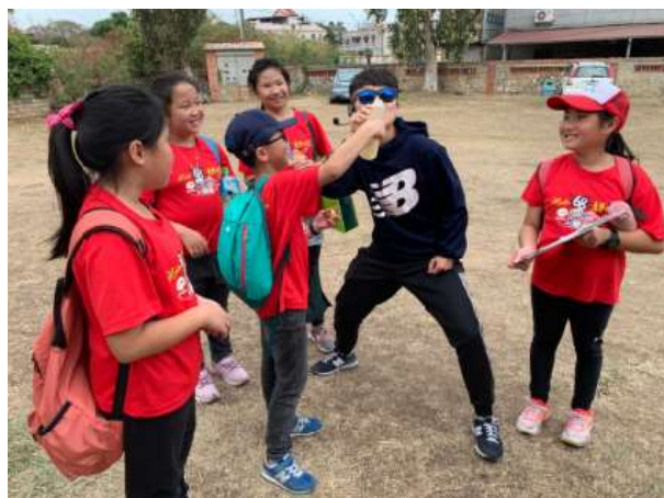
小隊執行老師餵食秀任務