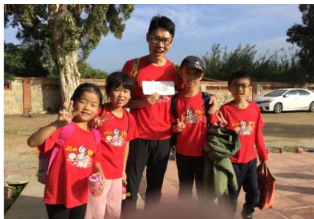
老師的名字你知道嗎？