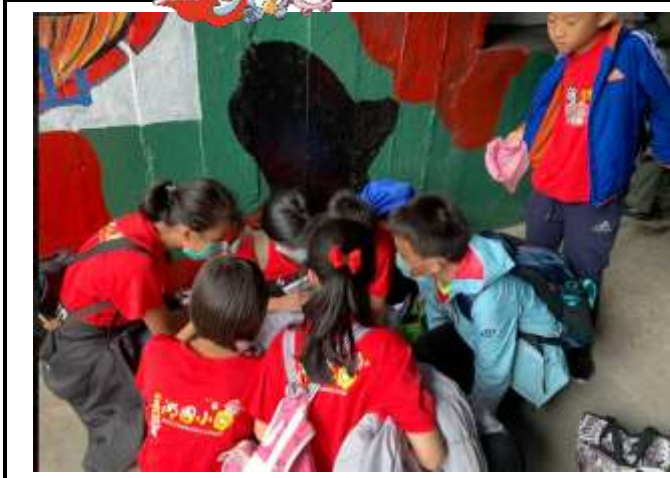
第一關獅山砲陣地