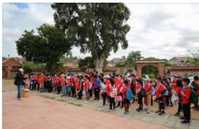
學生認真聽玩很大的遊戲規則 及各項注意事項