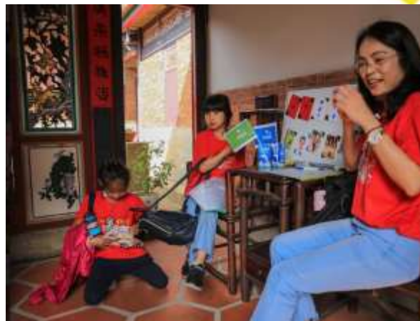
童玩對對碰你知道多少？