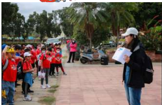
南北山聚落總指揮官說明任務