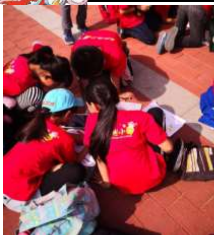
使用平板認真的將題目填寫完成