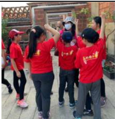
與十二魔月剪刀石頭布