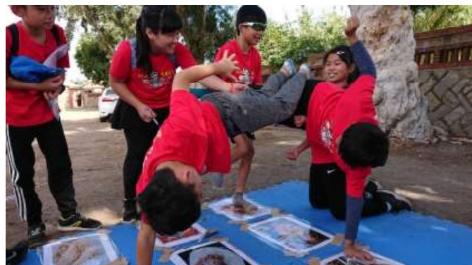
合力完成金門傳統美食十二宮格