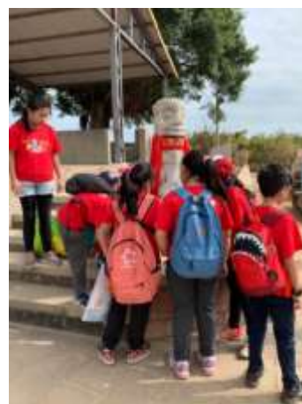
風獅爺身高有多高呢？