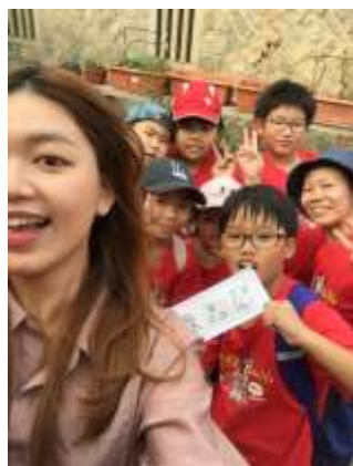
第九關找出十二魔月