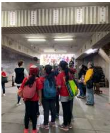
第二關獅山砲陣地-砲操