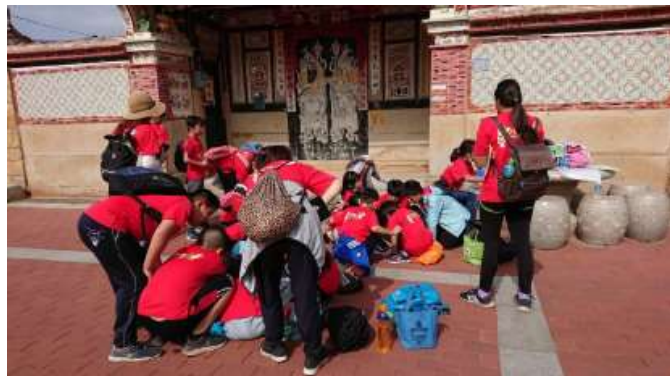
各小隊聚集在家廟前解任務