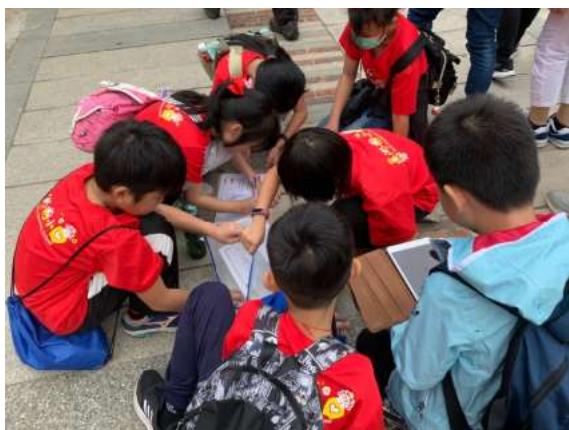
每個人都有自己的角色跟任務