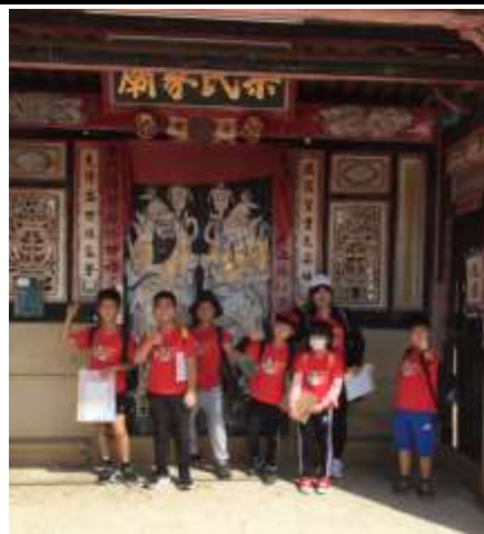
梁氏家廟守護著下堡這個聚落