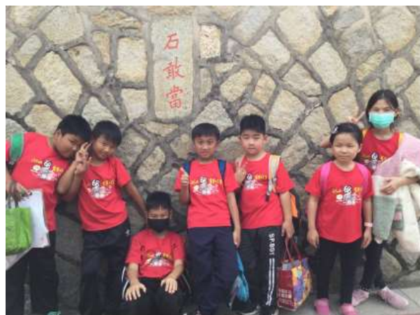
山后村莊內的石敢當