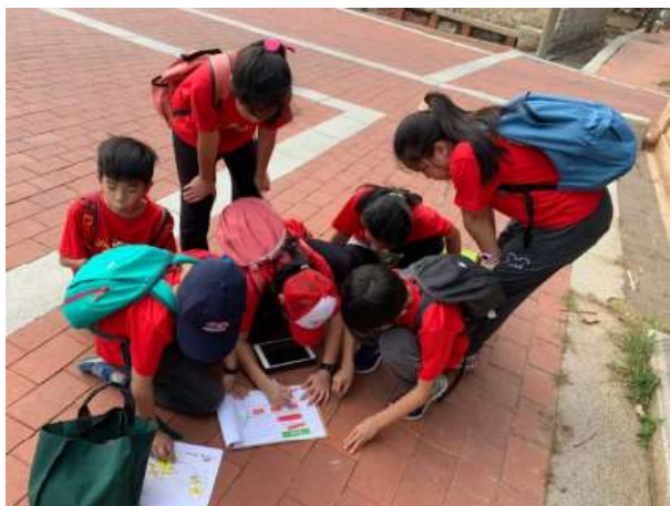
小組一起討論內容解題