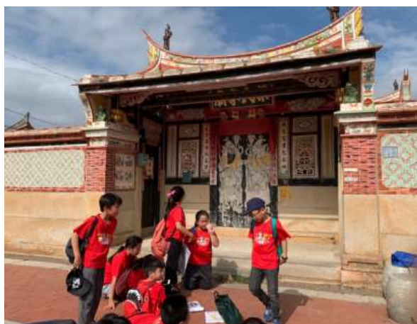
第八關感應廟&風獅爺