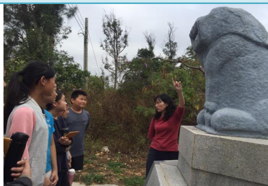
認真聆聽歷史由來