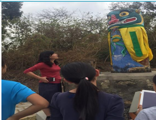
第二站：陽翟風獅爺