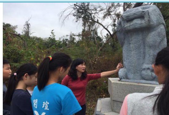
第一站：安民風獅爺