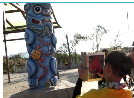
第三站：後水頭風獅爺