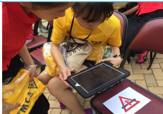
掃 QR-CODE 取得任務