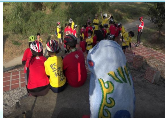
第四站：中蘭風獅爺