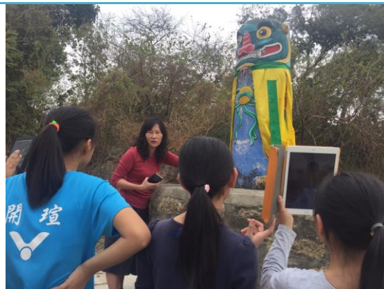
使用平板認真記錄